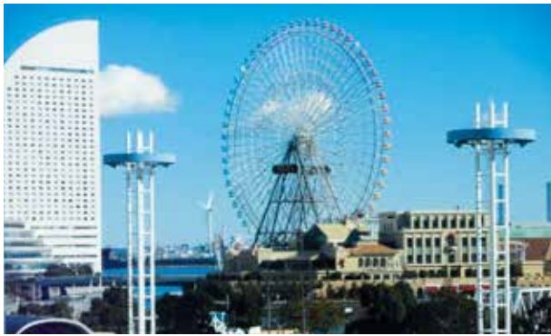
アトリエから見たみなとみらい

2019年度の作品展は、2020年2～3月に実施する予定です(会期・会場については決定次第発表)